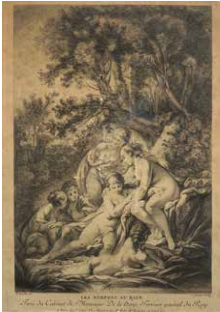
9 François BOUCHER (attribué à) (Paris 1703 - 1770) Les nymphes au bain Pierre noire 31,4 x 21,8 cm La gravure en contrepartie est conservée au verso du cadre 2 000 / 3 000 €